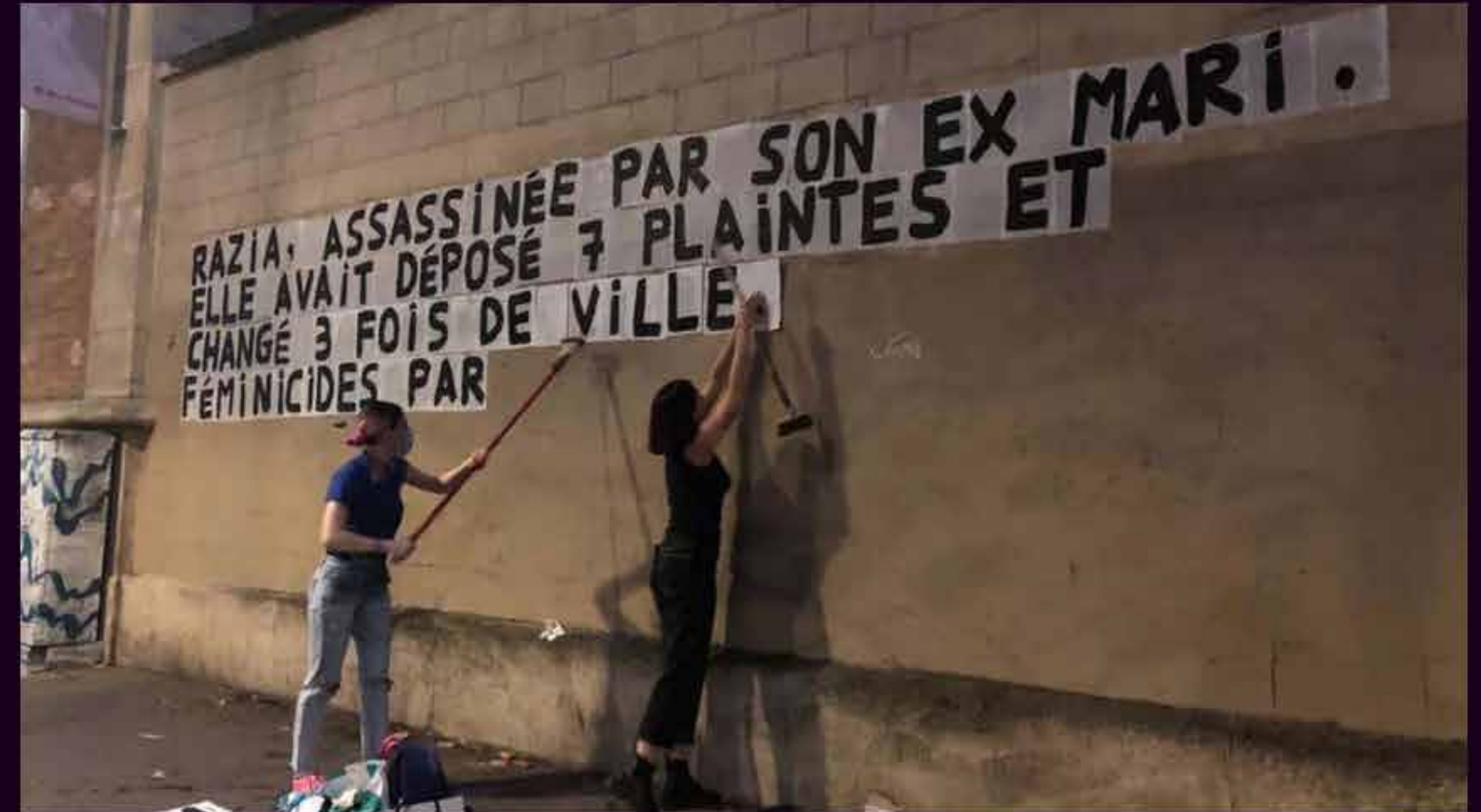
Collage dans une rue de Paris, 2020