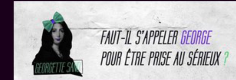
Logo et slogan de Georgette Sand, Collectif Georgette Sand, 2014

Je pourrai citer bien d'autres exemples de femmes marquantes de l'Histoire et de la mythologie projetées en emblèmes féministes dans le design depuis des décennies comme les Amazones (peuple de femmes guerrières dans la mythologie grecque), Cléopâtre (reine d'Égypte Antique au premier siècle avant Notre Ère), Simone de Beauvoir (autrice du Deuxième Sexe, paru en 1949), Simone Veil (ayant porté la lutte pour l'accès à l'IVG dans les années 70), Marguerite Yourcenar (première femme membre de l'Académie Française), etc. Je me contenterai de citer l'exemple de George Sand, romancière, dramaturge et journaliste connue pour son pseudonyme masculin et sa tumultueuse vie amoureuse, devenue l'égérie du collectif féministe Georgette Sand. On retrouve ce « rappel du passé pour comprendre les débats du présent » [25] dans les identités visuelles des collectifs féministes, puisque Georgette Sand reprend cette icône et son histoire pour justifier sa lutte dans le slogan : « Faut-il s'appeler George pour être prise au sérieux ? ». Toute l'identité visuelle du collectif est ainsi inspirée de cette femme de lettre du passé, par le choix d'une police de caractère réelle, typique de la période