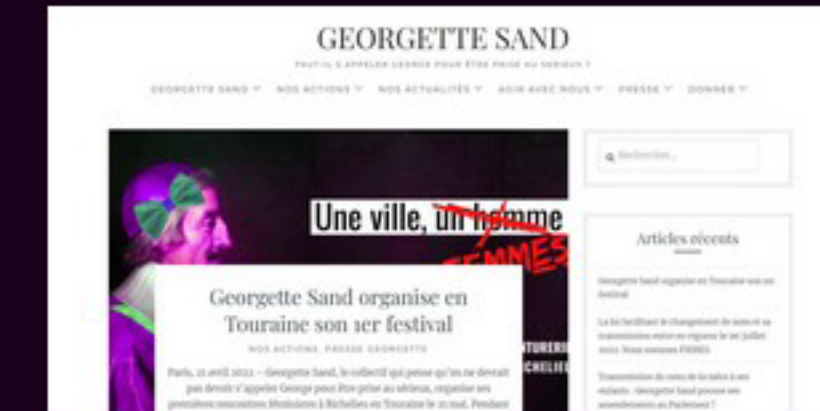
Site actuel de Georgette Sand, Collectif Georgette Sand, 2022